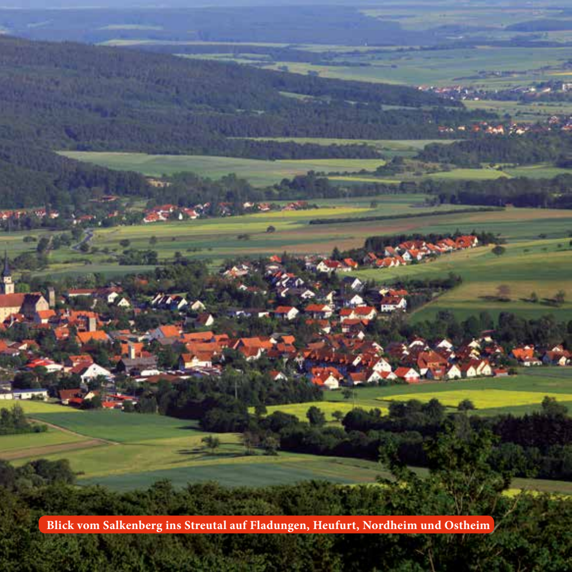
Blick vom Salkenberg ins Streital auf Fladungen, Heufurt, Nordheim und Ostheim