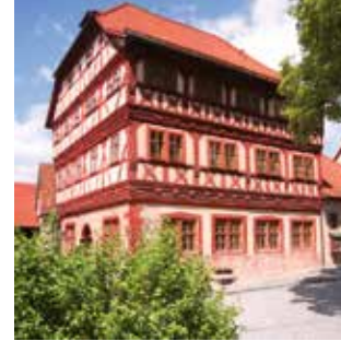
Das prächtige Centhaus