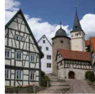
Malerwinkel in Nordheim