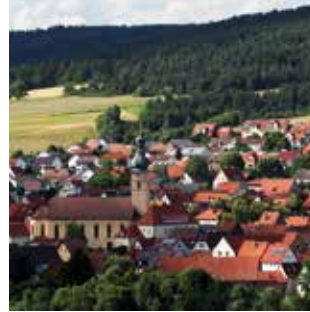
Kath. Pfarrkirche „St. Vitus“