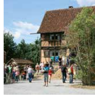
Fränk. Freilandmuseum in Fladungen