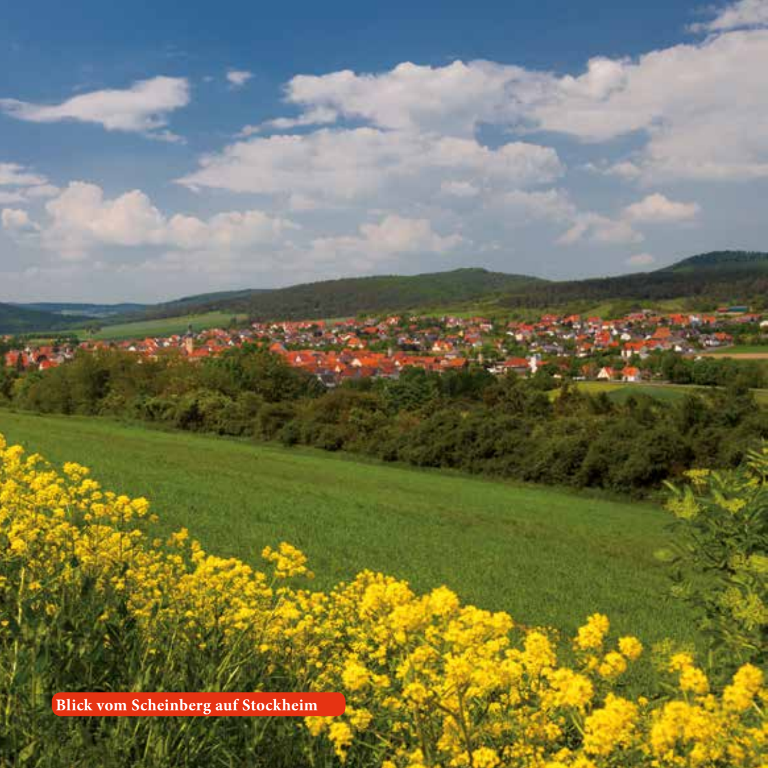
Blick vom Scheinberg auf Stockheim