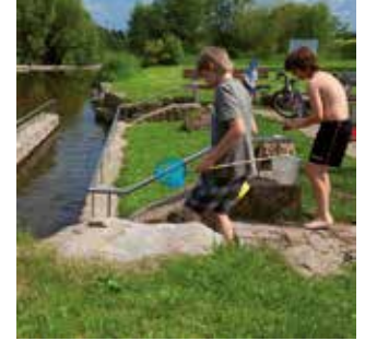
Kneipp-Tretbecken an der Streu