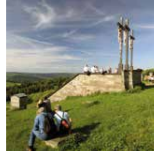
Kreuzberggipfel 928 m