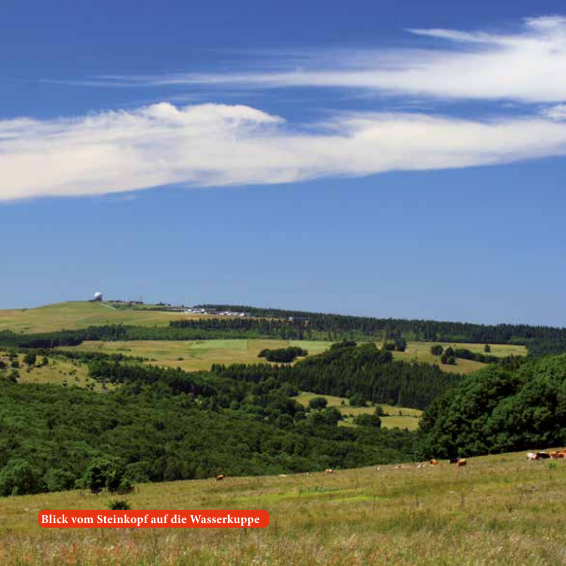
Blick vom Steinkopf auf die Wasserkuppe