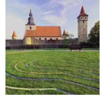
Imposante Kirchenburg in Ostheim