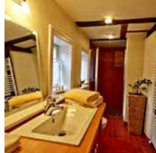
Die frühere Schwarzküche als Bad