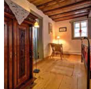
Schlafen in historischem Flair