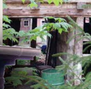
Tenne, heute Küche