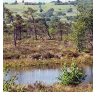
Moorauge im Schwarzen Moor