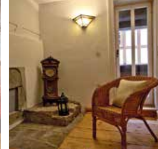
Zeit finden zum Nachdenken